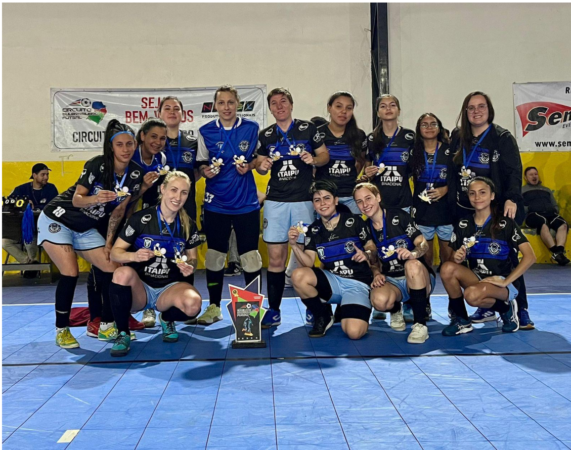
ETAPA AMCG SUB 17 E ADULTO (IVAÍ)